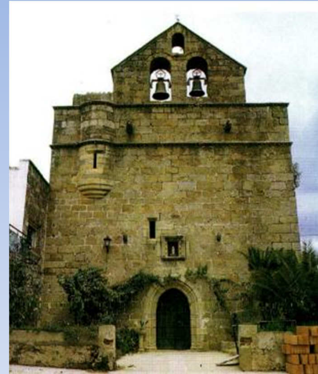
Parroquia de N.S. de la Concepción Cadalso de Gata