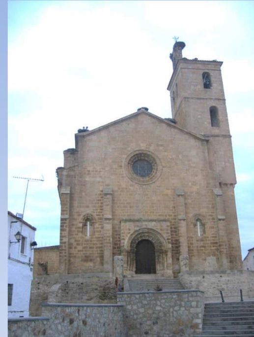
Parroquia de Santa María de Almocóvar Alcántara