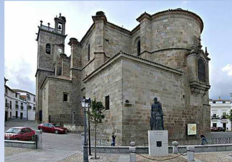
Parroquia de Santa María La Mayor Brozas

(Biblia, DSI, Bioética, Agentes de Pastoral, Teología, Catequistas, Espiritualidad, Escuela Cofrade, Monitores OTL...)