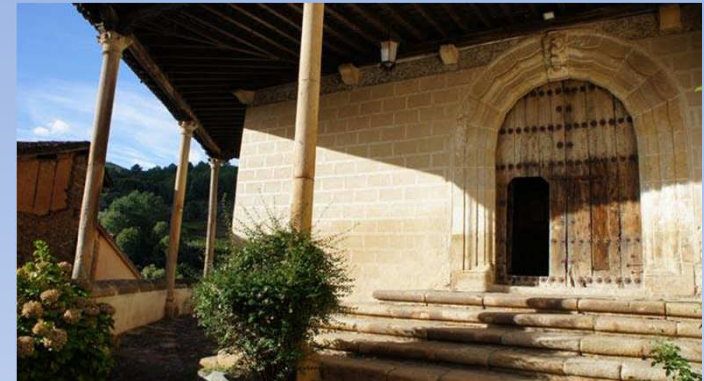
Nuestra Señora de la Asunción Robledillo de Gata