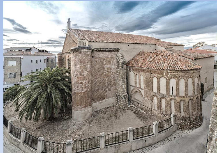
Parroquia de Nuestra Señora de la Asunción Galisteo

"[...] La Iglesia Diocesana favorecerá los mecanismos para ello [formación del laicado], dotando de la estructuras diocesanas, arciprestales y parroquiales que sean necesarias con capacidad de actualizar y complementar las orientaciones del presente Sínodo"