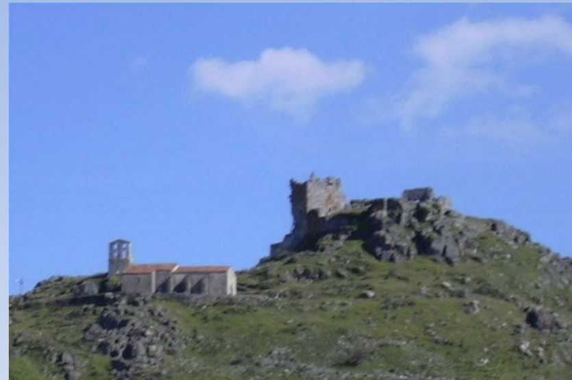
Parroquia de San Juan Trevejo