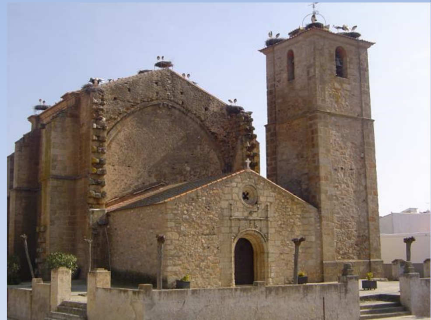
Parroquia de Santa María de Gracia Mata de Alcántara

144.- La Iglesia Diocesana potenciara el Foro de Laicos de la diócesis para el apostolado seglar asociado, como cauce de encuentro, comunicación y dialogo, a fin de animar la comunión de las asociaciones y movimientos, y promover una mas eficaz colaboración en sus actividades e impulsar la corresponsabilidad de los laicos en la vida y misión de la Iglesia en la sociedad. Del mismo modo los movimientos y asociaciones han de comprometerse con este Foro de Laicos Diocesano.