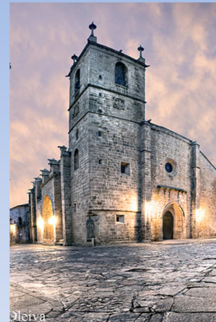
Concatedral de Santa María Cáceres