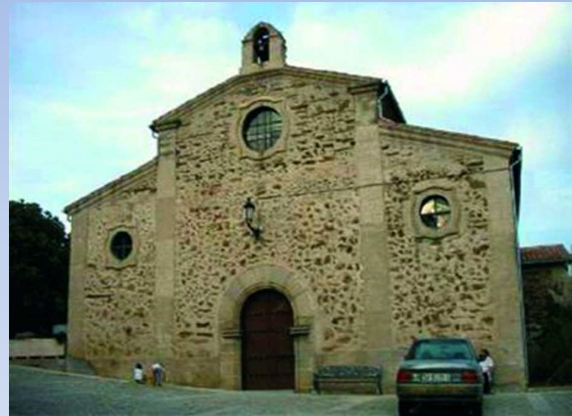
Parroquia de El Espíritu Santo Casar de Palomero

62.- Los párrocos y demás responsables de la educación en la fe deben invitar, mentalizar, sensibilizar y promover la conciencia social y la importancia del compromiso socio-caritativo a todos los cristianos de nuestras parroquias, grupos, asociaciones, movimientos y cofradías para que no vivamos indiferentes ante las situaciones de pobreza e injusticia en las que se encuentran muchas personas cercanas y lejanas.