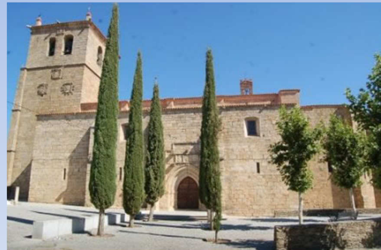
Parroquia de San Pedro Apóstol Garrovillas