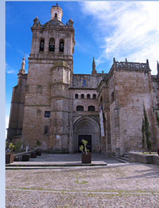
Catedral de Santa María de la Asunción Coria