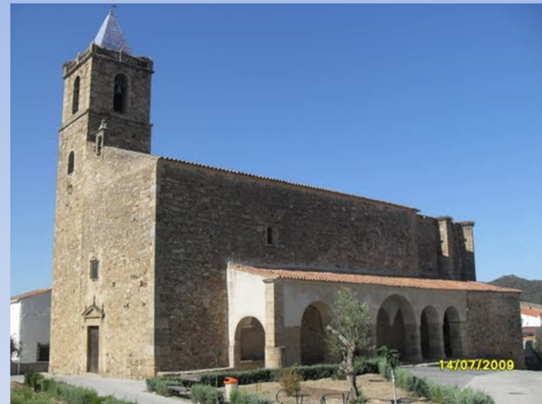
Parroquia de San Miguel Arcángel Zarza de Montánchez