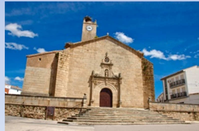
Parroquia de Nuestra Señora de la Asunción Malpartida de Cáceres