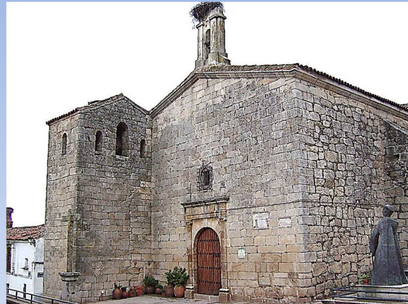
Parroquia de Santa Marina Pedroso de Acim

125.- Los sacerdotes ayudarán a los laicos cristianos a comprometerse en la vida social, política, laboral y cultural de nuestra sociedad.